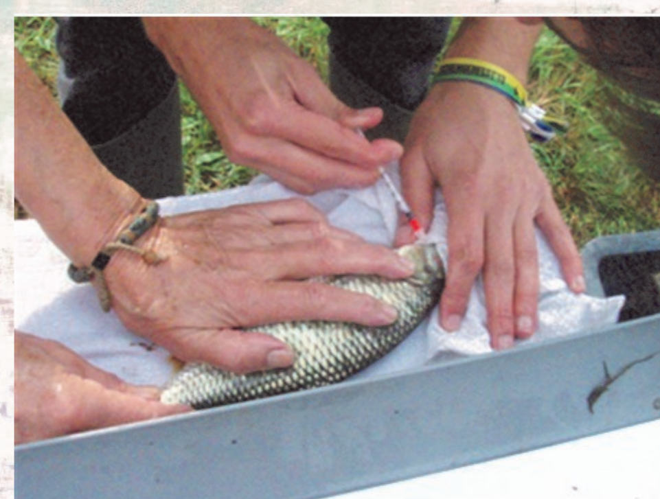
Označevanje rib za sledenje njihovega gibanju