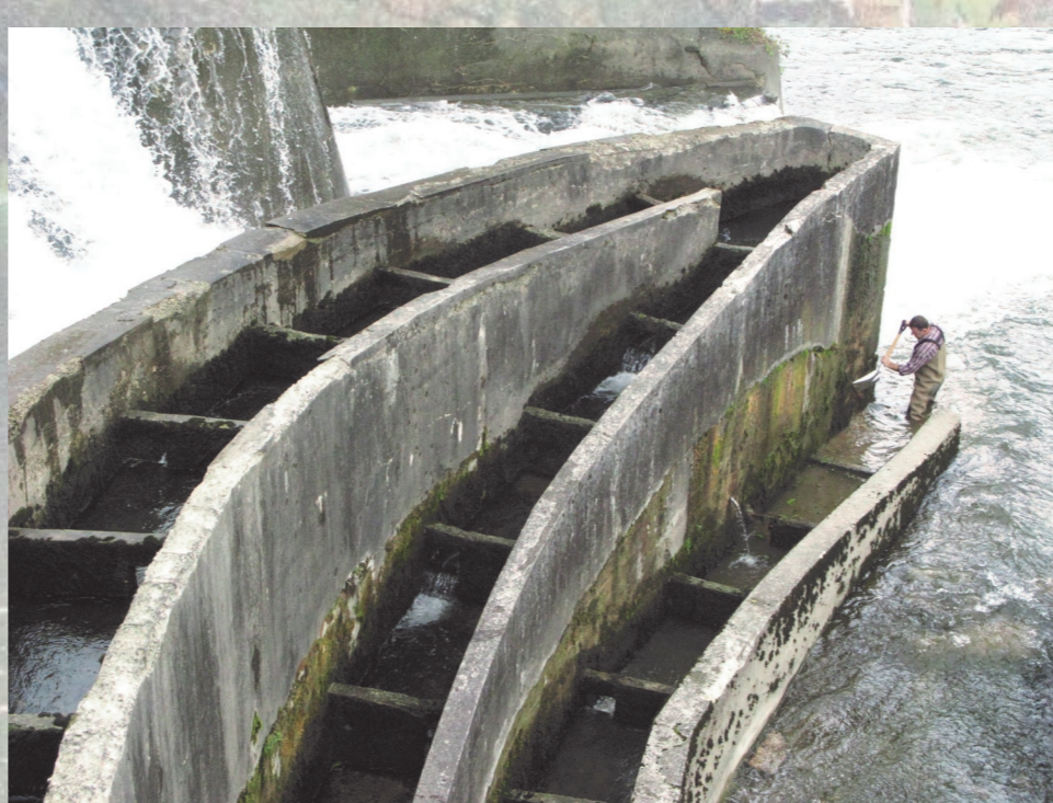
Obnova ribjega prehoda ob Fužinskem jezu