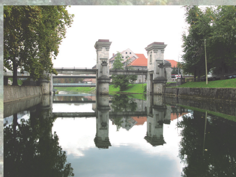
Posodobitev sistema zapornic in ribjega prehoda pri Ambroževem trgu