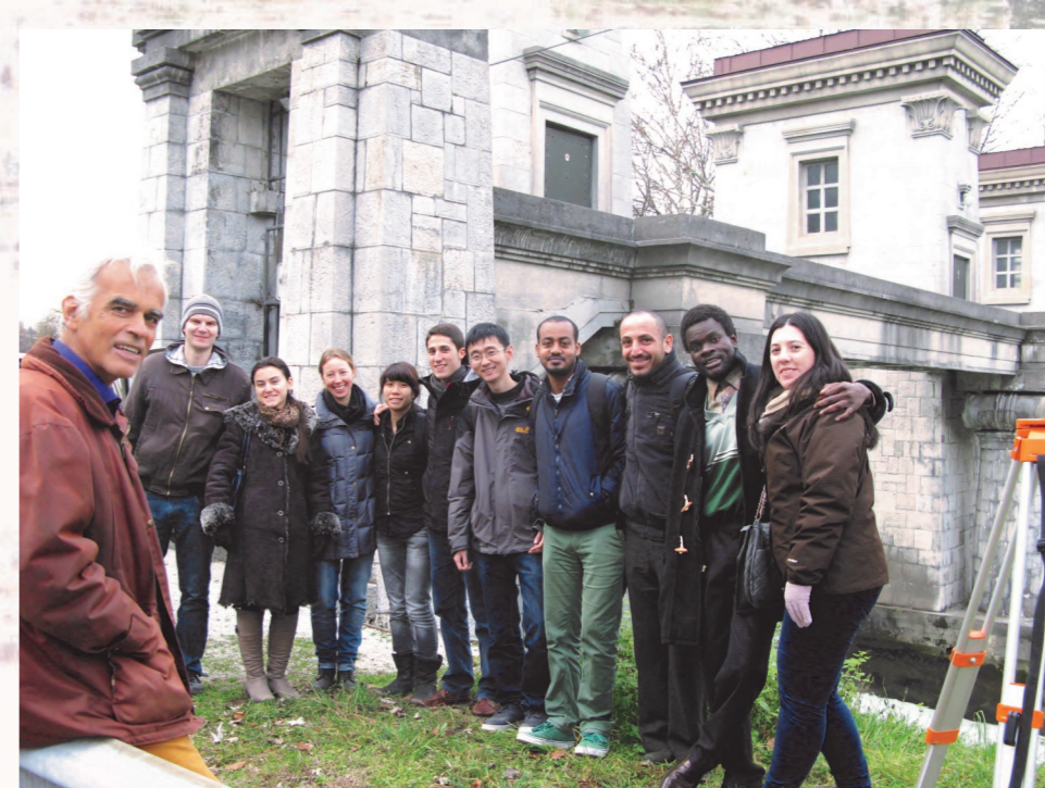
Sodelovanje študentov Msc Flood Risk Management pri meritvah