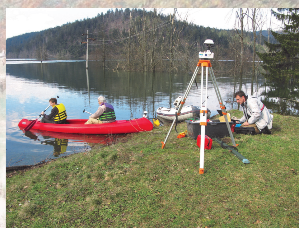
Meritve na Planinskem polju