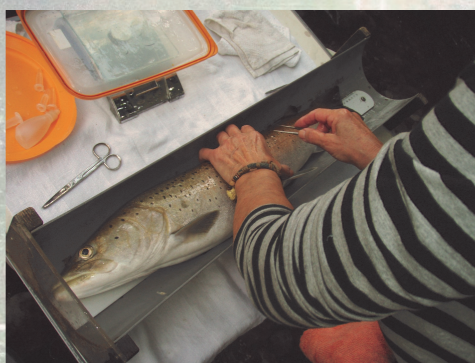
Monitoring rib pred izpustom v reko