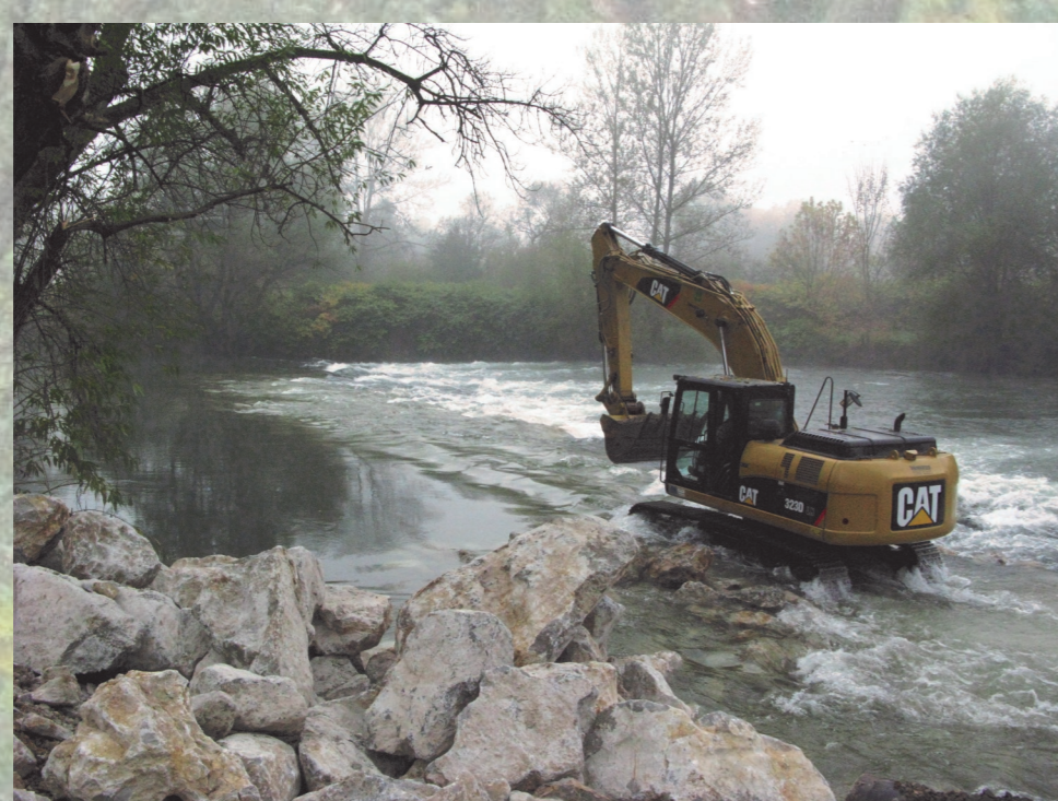
Obnova praga v Zalogu