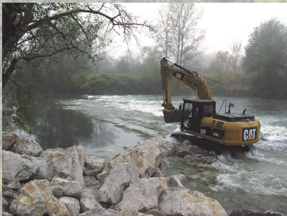
Obnova praga v Zalogu