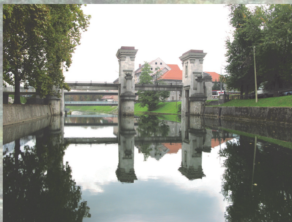
Posodobitev sistema zapornic in ribjega prehoda pri Ambroževem trgu