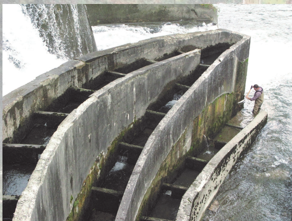
Obnova ribjega prehoda ob Fužinskem jezu