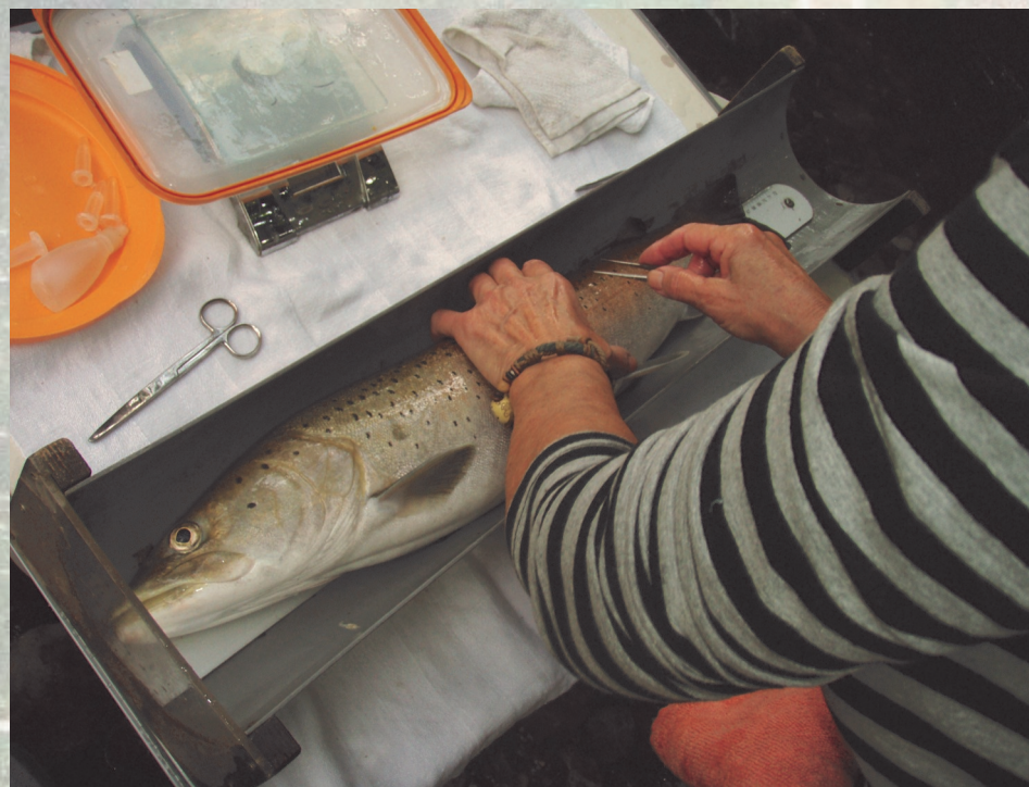
Monitoring rib pred izpustom v reko