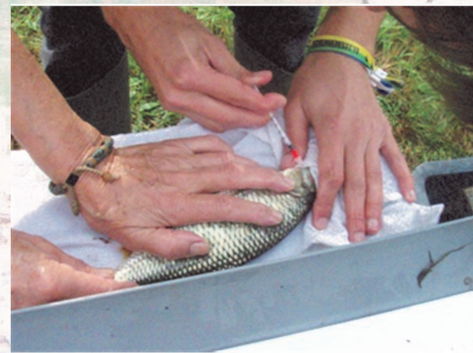
Označevanje rib za sledenje njihovem gibanju