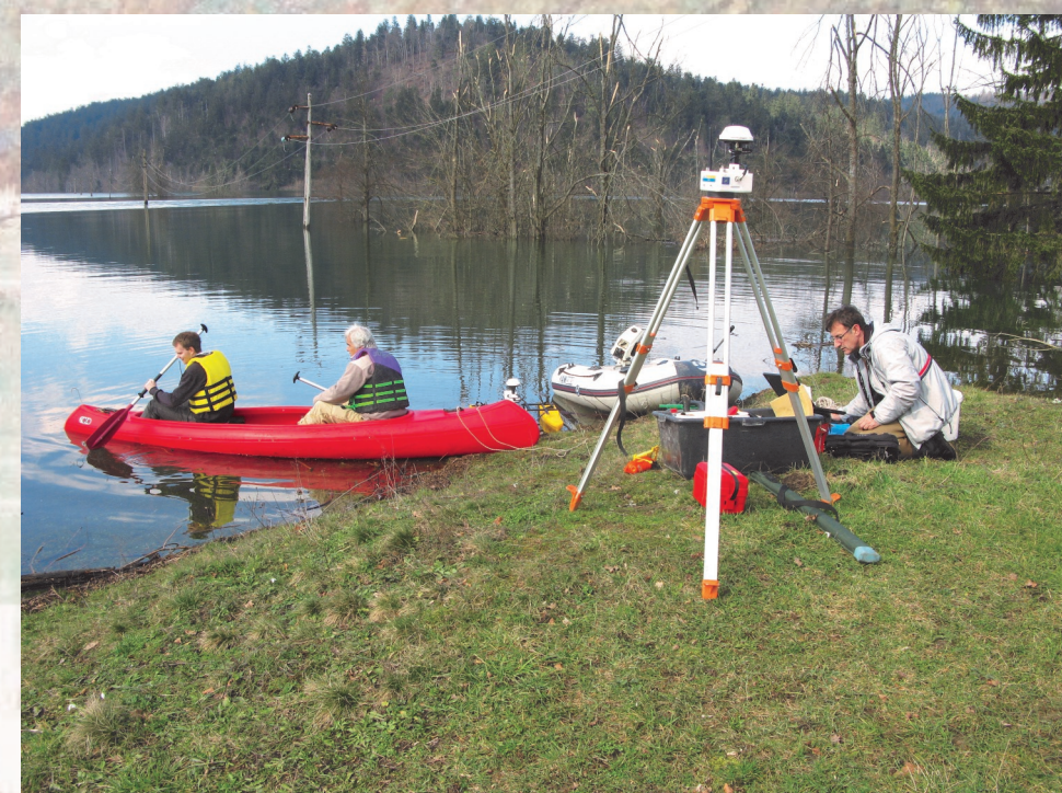
Meritve na Planinskem polju