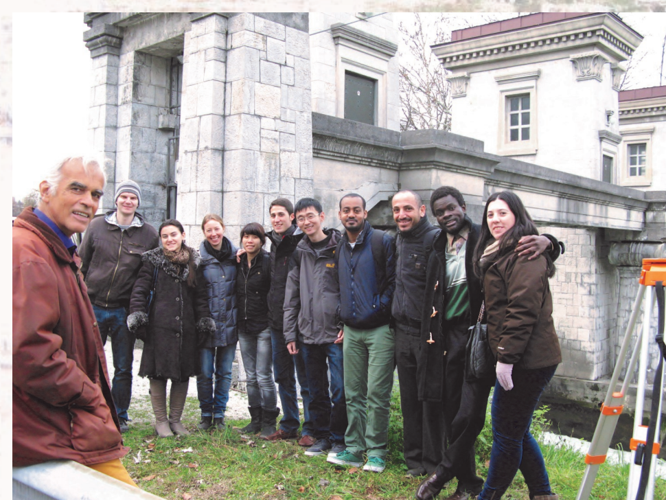
Sodelovanje študentov Msc Flood Risk Management pri meritvah